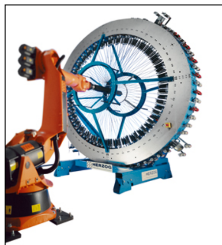
Плетельная машина радиального типа на 144 веретена с многоосевым манипулятором

Количество плетельных веретен, перемещаемых крылатками при плетении, выбирается заказчиком в зависимости от размера и сложности изготавливаемой преформы и может варьировать от 48 до – 288 штук.