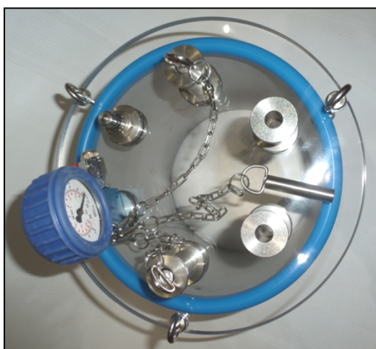
Рис. 5: Вид сверху