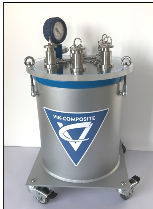
Рис. 1: SK3VAC-15L0WR12x4