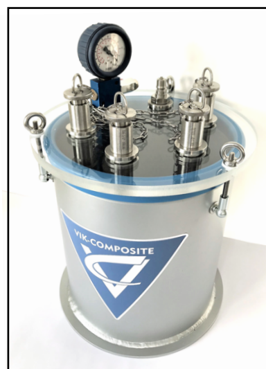
Рис. 6: SK3VAC-15L4WS12x4

В зависимости от комплектации продукт может слегка отличаться от фотографии.