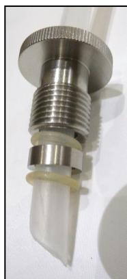
Рис. 2: фитинг