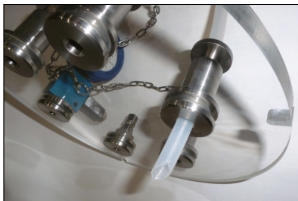
Рис. 3: Открытая крышка с зажатой трубкой