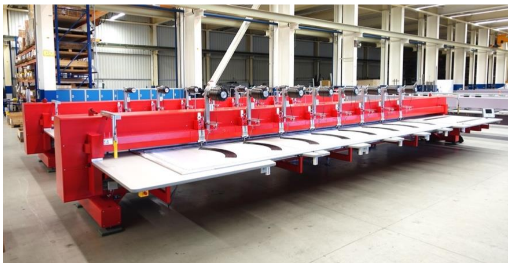
ZCW 0800-900D (1500)